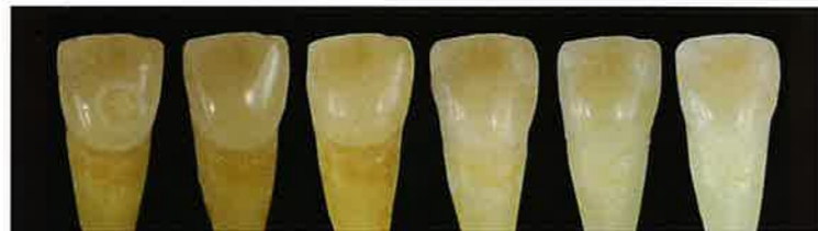
タイミングを選ばず、ホワイトニング前でもコンポジット修復が可能に。 オパールエッセンスホワイトニングシステムと組み合わせて使用すると相性◎

トランセンドユニバーサルボディシェードを使用して修復した部位はホワイトニング中においても他部位と調和し、シェードがマッチします。 1