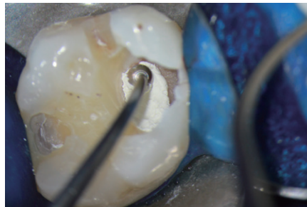
バイオシーリペアを露髄面を刺激しないように圧接。