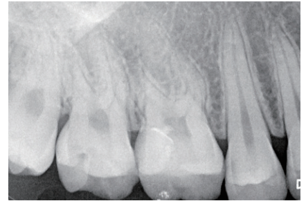
術後のデンタルX線写真。