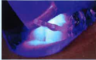
Fig.7 ポストおよびコアの築造を行った後は、光量が適切な照射器を用いて、様々な角度から十分な時間の照射を行い重合硬化させる。