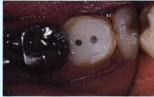
Fig.8 エステコアは待機時間がないので、光照射を行った後、直ちに不要なトクヤマFRポストを切断除去し、支台歯形成を行うことができる。