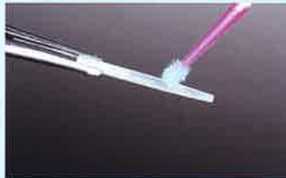
Fig.3 ボンドマー ライトレスを、試適後のトクヤマFRポスト全面に塗布。事前に切断することなく操作の簡便性を優先した。