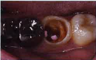
Fig.2 う蝕象牙質を染色しつつ除去すると残存歯質が非常に薄くなった。歯根破折を回避するため、ファイバーポストを用いた直接法の築造を行うことで同意を得た。