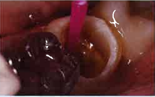
Fig.5 根管内にボンドマー ライトレスを塗布し、エアプローチを確実に引き出す。ファイバーポストの処理と同時に行えば時短となる。