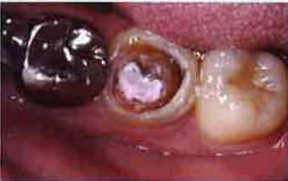
Fig.1 根管治療が終了した後の状態。

また、光が届きにくい部分、あるいは根管内のように乾燥が充分できない部位でも確実に重合硬化し、さらに築造後には時間を待たず、ただちに支台歯形成を行えるソリューションが提供されていることは、臨床医にも患者中心の医療としても非常に有益である。