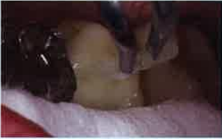
Fig.6 コア用レジンのエステコアを用いたポスト孔内に充填し、次いでファイバーポストのトクヤマFRポストを適正な位置に挿入し、光照射を行う。