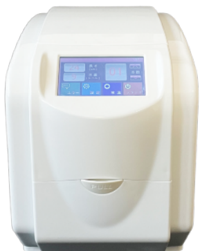
自動除菌ワイプス生成機

MWロール70 6ロール 定価6,720円(税別) シアーミスト 2L 定価6,800円(税別)